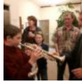
Juniorbläs ergewinnun g