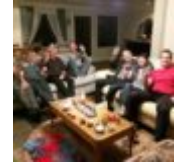
der Tagesauskl ang