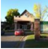
Park Falls UCC