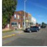
in Park Falls