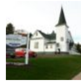
Congregational United Church of Christ, Mellen, Wisconsin