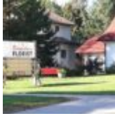
Florist in Park Falls