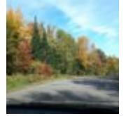
Wunderschöne Herbstfärbung wohin man blickt